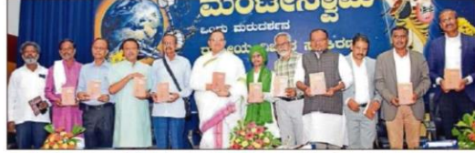
ಮೈಸೂರಿನಲ್ಲಿ 'ಜೀವಕಾರುಣ್ಯದ ಮಂಟೇಸ್ವಾಮಿ ಕಾವ್ಯ ಉಳಿಸಿ' ಎಂಬ ಉದ್ದೇಶದಿಂದ ಮೈಸೂರಿನಲ್ಲಿ 'ಜೀವಕಾರುಣ್ಯದ ಮಂಟೇಸ್ವಾಮಿ ಕಾವ್ಯ ಉಳಿಸಿ' ಎಂಬ ಉದ್ದೇಶದಿಂದ...