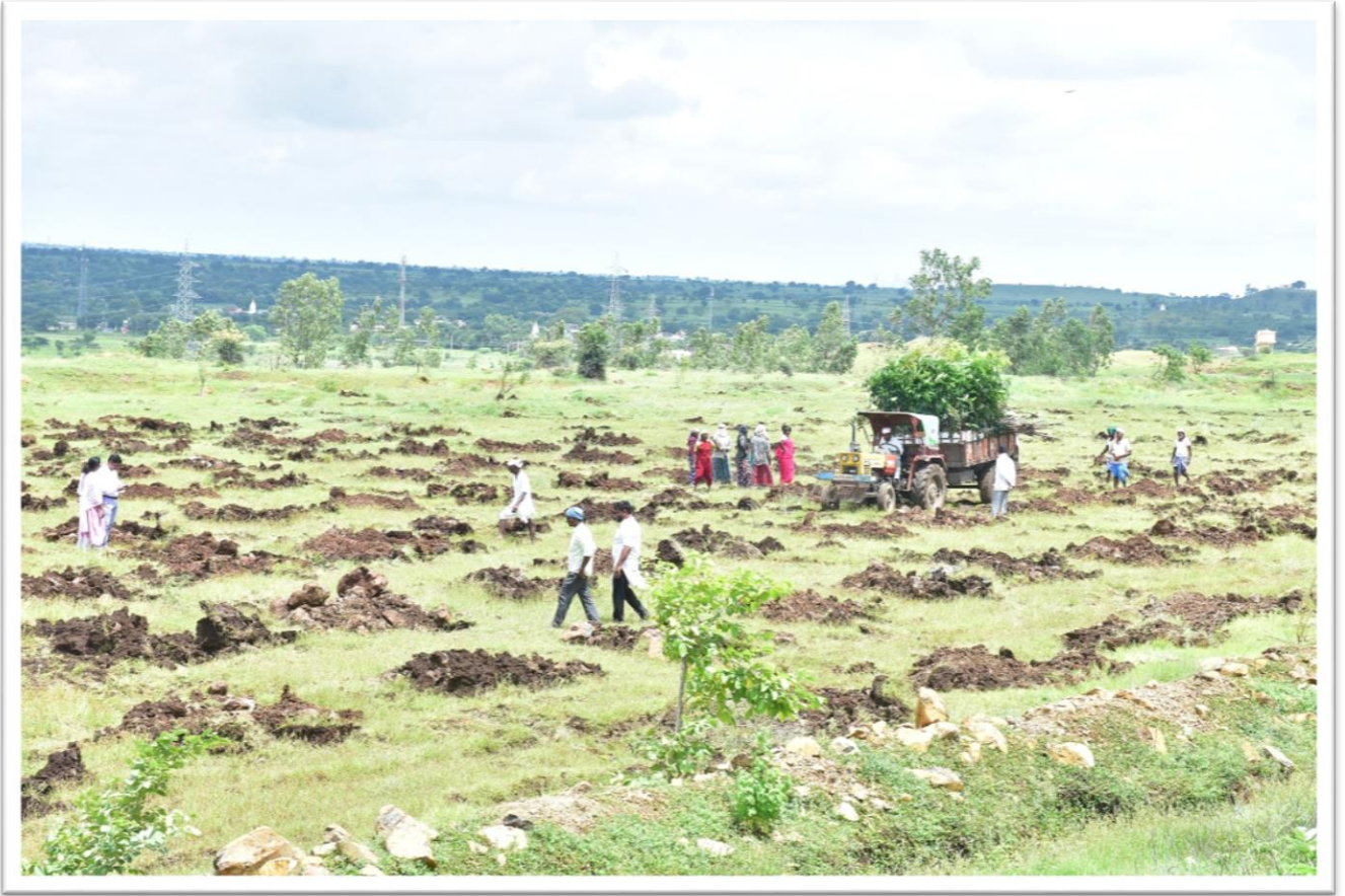
Kalyana Vana 1, Site 1