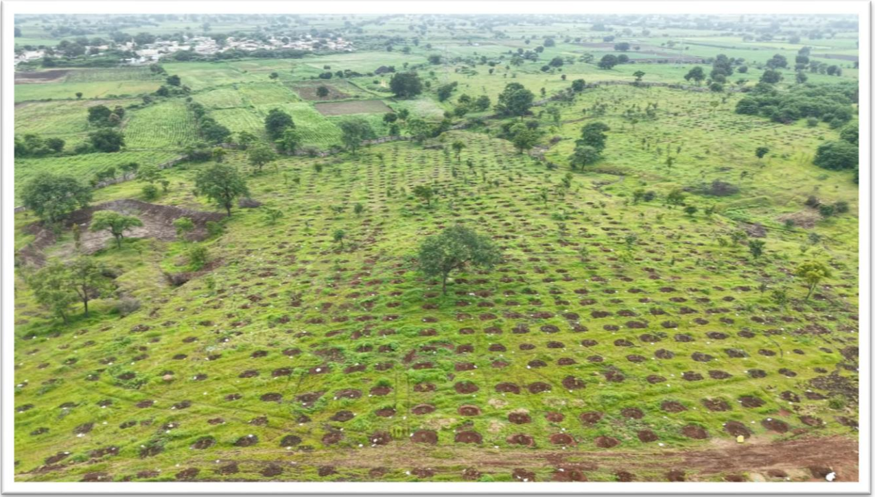
Kalyana Vana 2