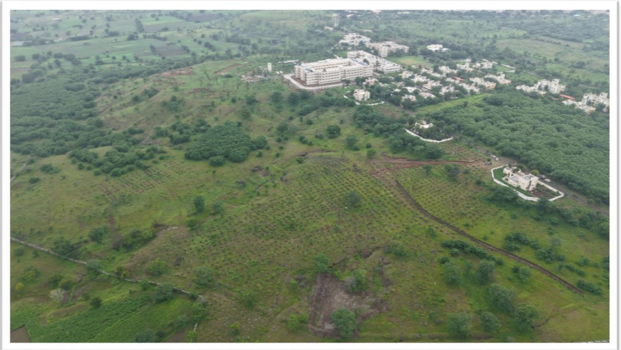
Kalyana Vana 2