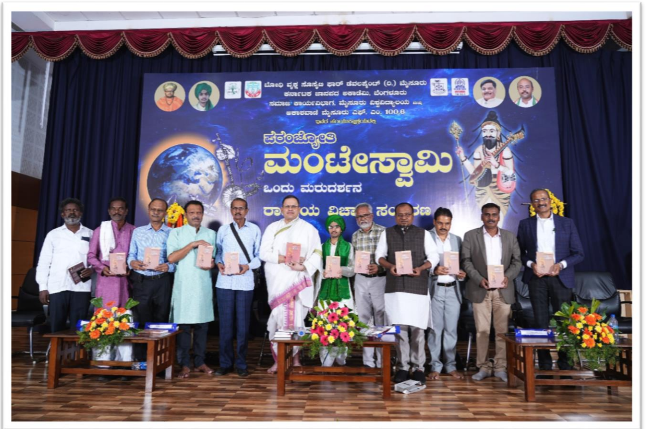
Inauguration of National Seminar on 'Paranjyothi Manteswamy Tradition: A Revisit'