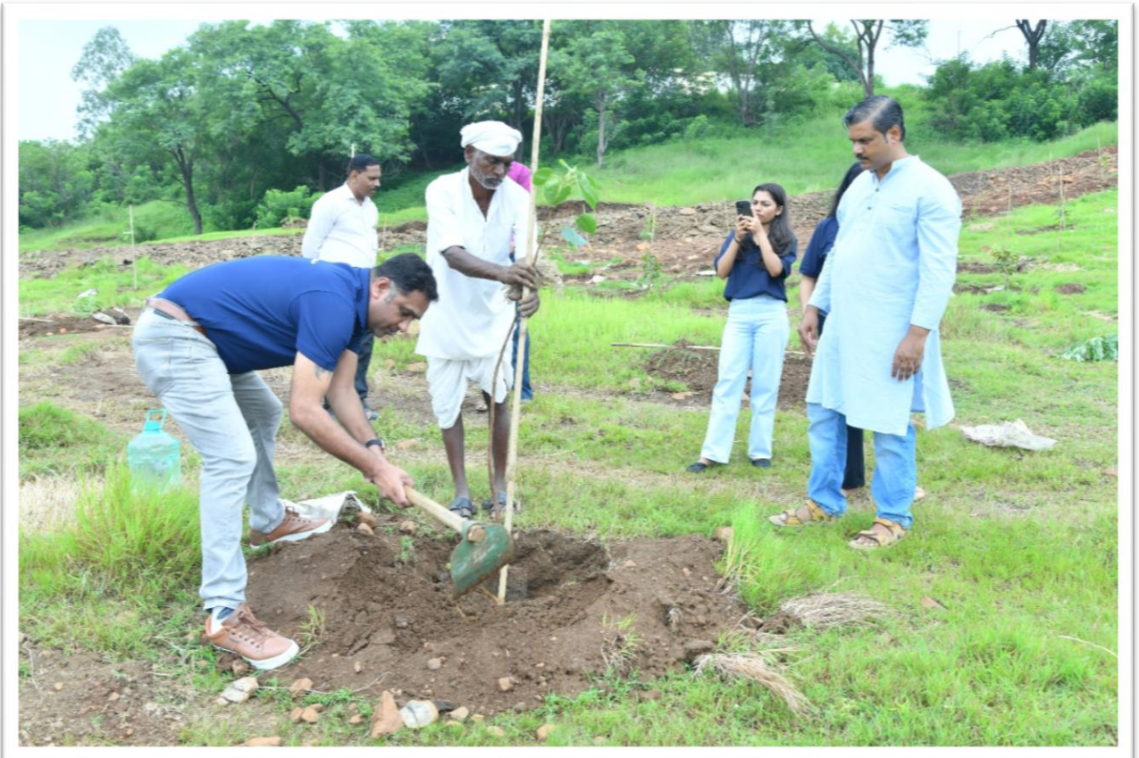
Tree Plantation @ Kalyana Vana 2